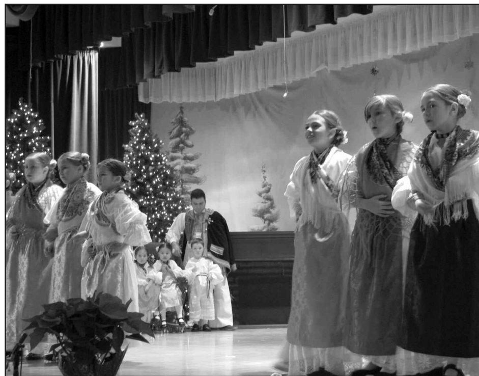
Za koreografiju i raspored programa pobrinuo se Željko Jergan